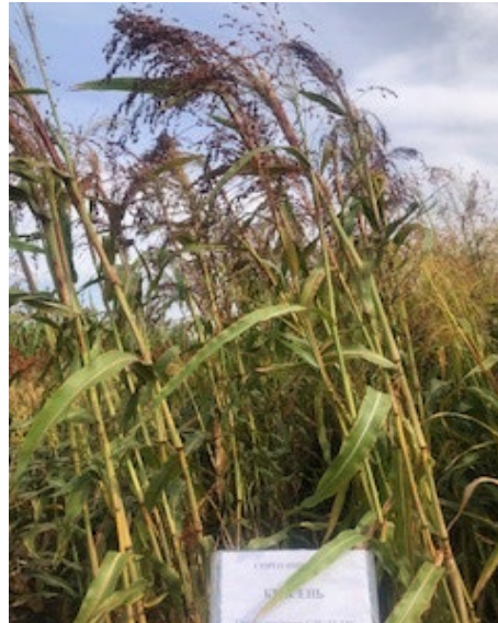
Рис. 5. Біомаса сорго віничного для переробки на енергетичні цілі (біоетанол, біогаз), Дослідне поле ІБКІЦБ НААН, 2025 р.