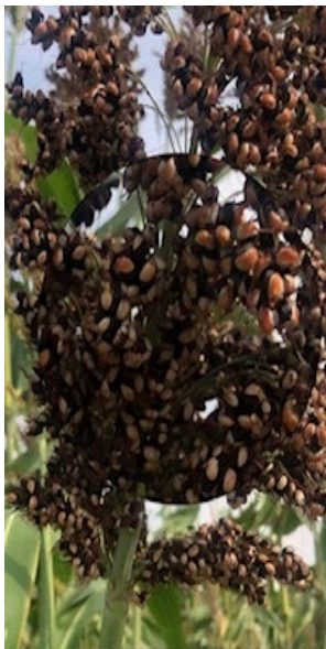
Рис. 2. Агрофітоценози сорго цукрового, Дослідне поле ІБКіЦБ НААН, 2025 р.