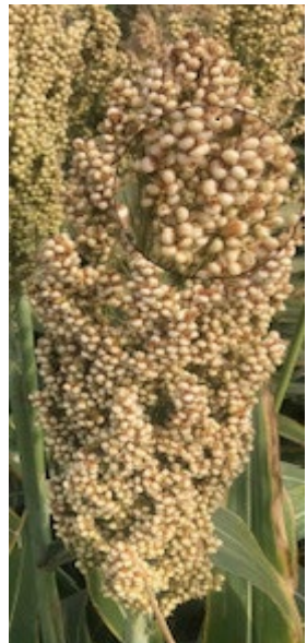
Рис. 3. Волоті сорго цукрового, Дослідне поле ІБКіЦБ НААН, 2025 р.