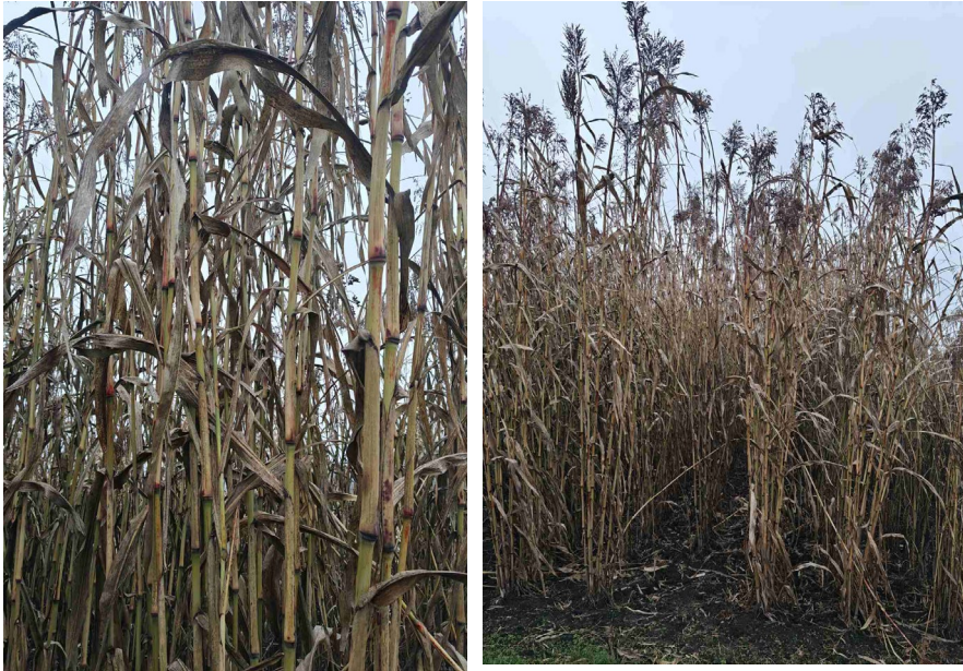
Рис. 6. Біомаса для переробки на тверде паливо (пелети, брикети)