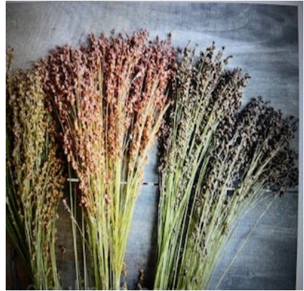
Рис. 4. Збирання зерна і переробка на віники